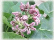
ガガイモ (キョウチクトウ科/8~9月/淡紅紫)