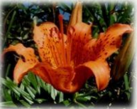
スカシユリ (ユリ科/6~7月/橙)

男性的な「陽」の面を強く発揮して さばさばと働く人に 母性の優しさと温かさを取り戻す