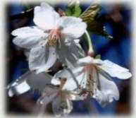
オオシマザクラ (バラ科/3~4月/白)